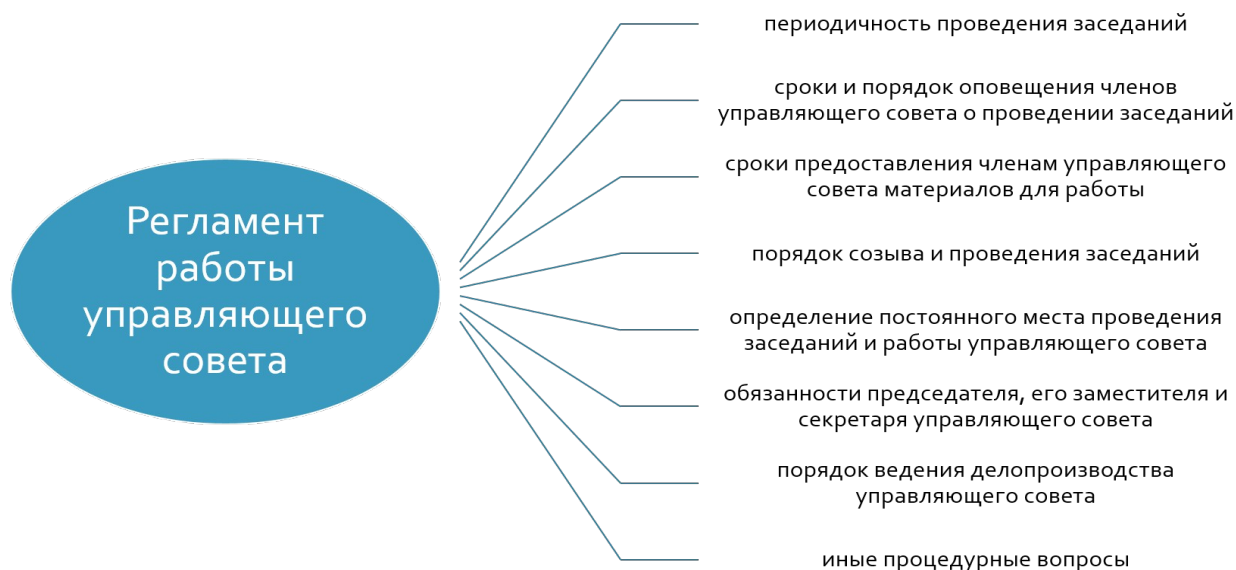
– Регламент работы управляющего совета

Для более подробной регламентации процедурных вопросов порядка своей работы управляющим советом разрабатывается и утверждается регламент работы управляющего совета (рисунок 3) [26].